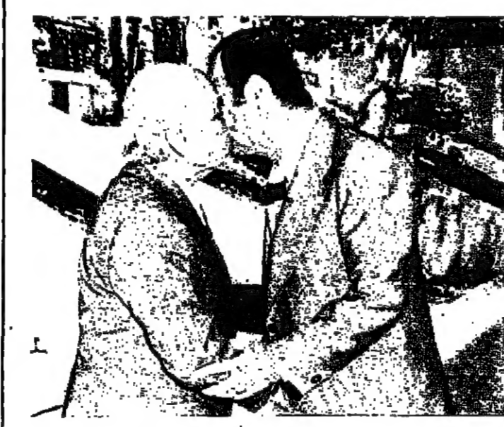
الرئيس الاسد يستقبل الرئيس سلام

الملك خالد - تنمة احياء مدينة الملك فيصل .. وقد استغرقت الزيارة حوالي عشر دقائق اطعموا خلالها على ما تحبته الدولة للمهجريين المائلين من رعاية وخدمات . وادى الرئيس السادات والملك خالد بعد ذلك صلاة الظهر بمسجد المغفور له الملك فيصل ، ثم استقل سيارة مكتوبة الى خارج مدينة الملك فيصل وسط حشود كبيرة من جماهير السويس التي وقتت ترحيباً للزيمين المصريين بالتنظيف والتهنئة . وكان الملك خالد والرئيس السادات قد شهدا امس الاول مناورة بحرية تبالة الاسكندرية ، وقتلت «الاهرام»